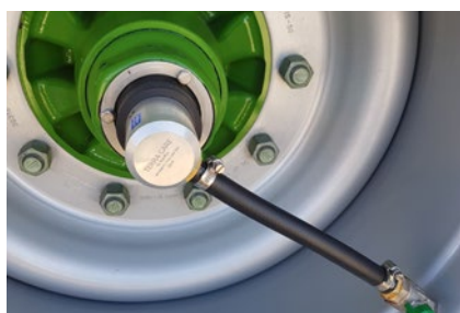
Das Regelsystem ist wahlweise für Ein-, Zwei- oder Dreiachs-Anhänger erhältlich.